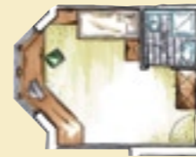
Einzelzimmer bis 19 m 2