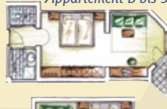
Appartement B bis 36 m 2