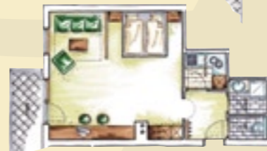
Appartement A bis 45 m 2

Skizzen sind symbolisch und können von der Realität abweichen.