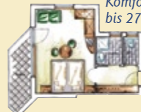
Komfortzimmer bis 27 m 2